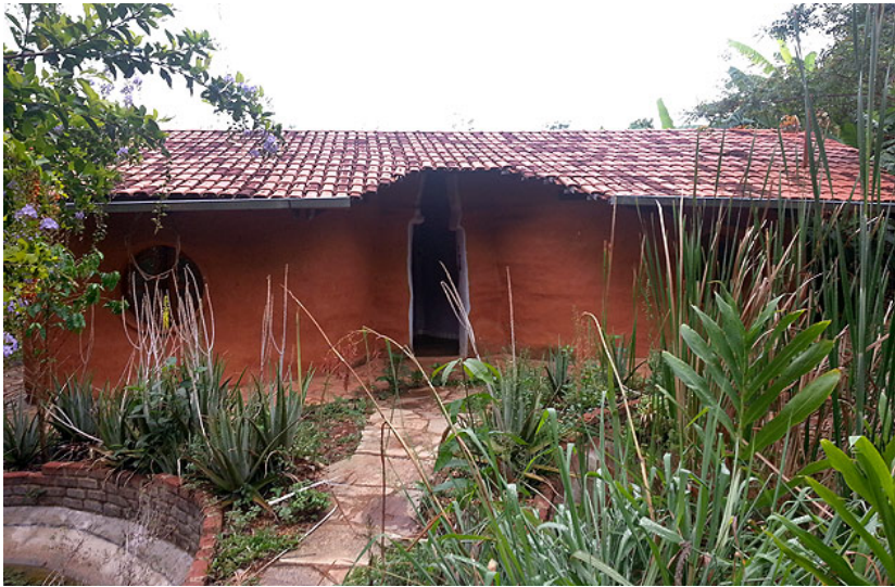
Local de hospedagem dos Centro de Tecnologia de Permacultura no Brasil, em Goiás